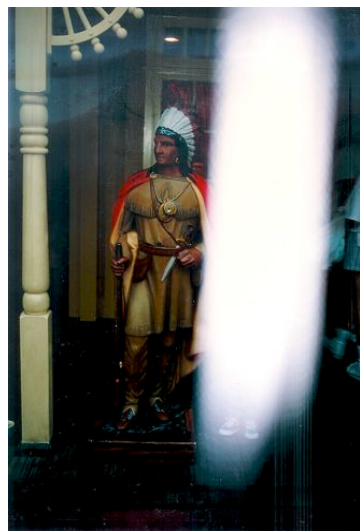
Las citas de las escrituras son tomadas de la Biblia Reina Valera rev. 1995